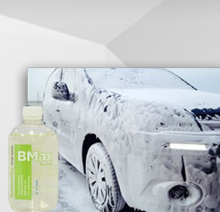
BubbleMax Shampoo UMYJ SAMOCHÓD