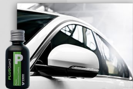
PlusGard ZABZPIECZ ELEMENTY PLASTIKOWE