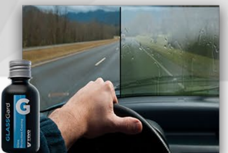
GlassGard NAŁÓŻ POWŁOKĘ NA SZYBY