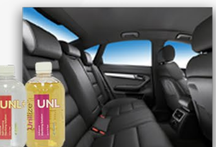
Unilize/Unilize+ ZABEZPIECZ WNĘTRZE PRODUKTEM ANTYBAKTERYJNYM