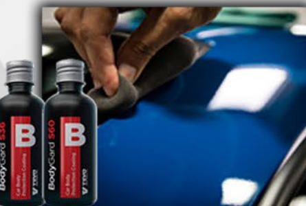
BodyGard S36/ S60 NAŁÓŻ POWŁOKĘ NA LAKIER