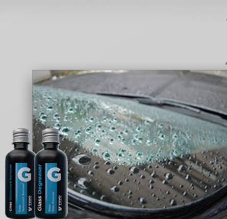
Glass Degreaser/Watermark Remover ODTŁUŚĆ POWIERZCHNIE SZKLANE, ZMYJ CAŁY OSAD Z WODY