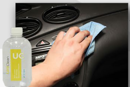
UniClean WYCZYŚĆ WNĘTRZE SAMOCHODU