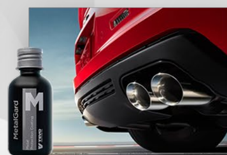
MetalGard NAŁÓŻ POWŁOKĘ NA POWIERZCHNIĘ METALOWĄ, STALOWĄ