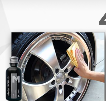
MetalScrub WYCZYŚĆ ELEMENTY STALOWE, METALOWE I CHROMOWANE